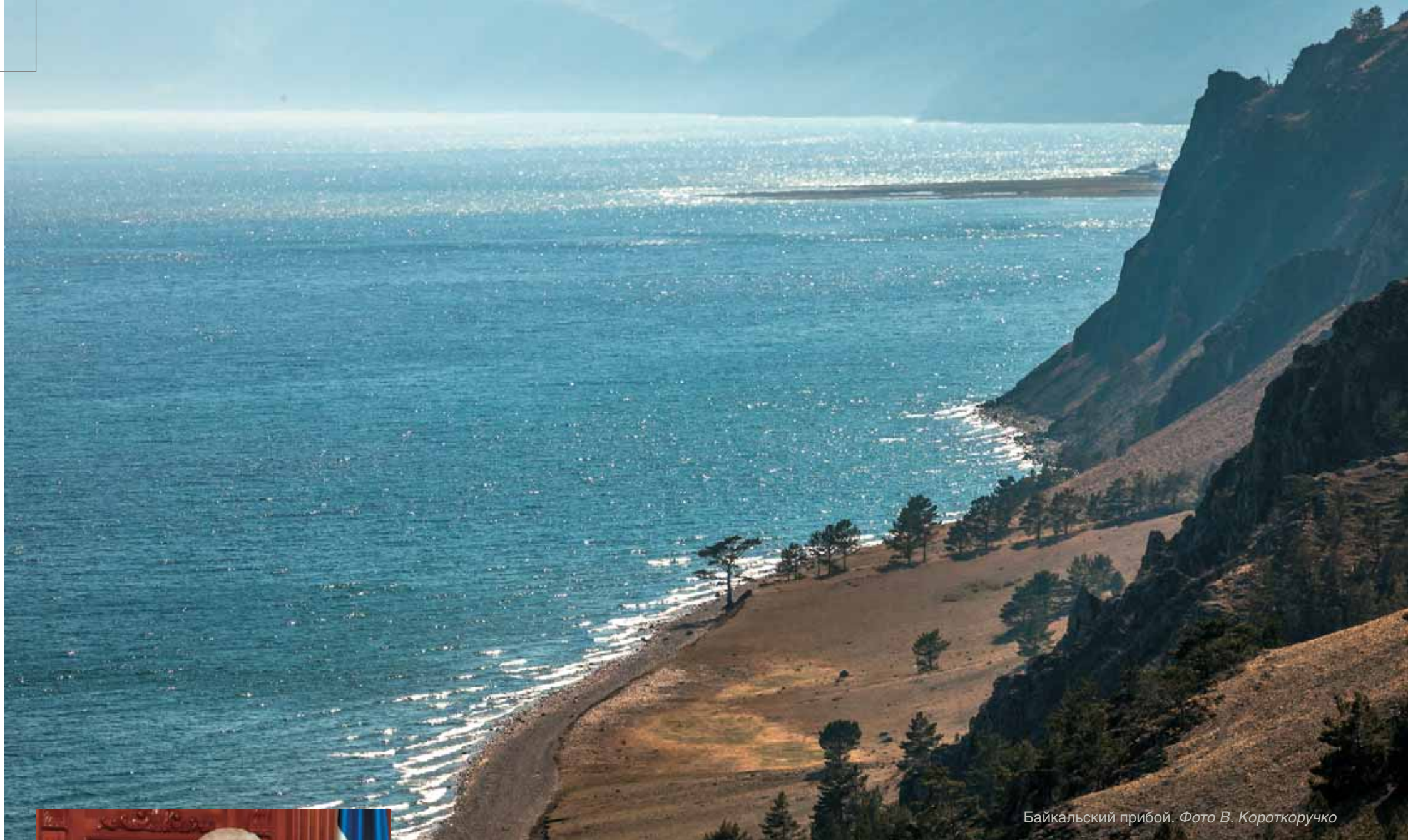
Байкальский прибой.