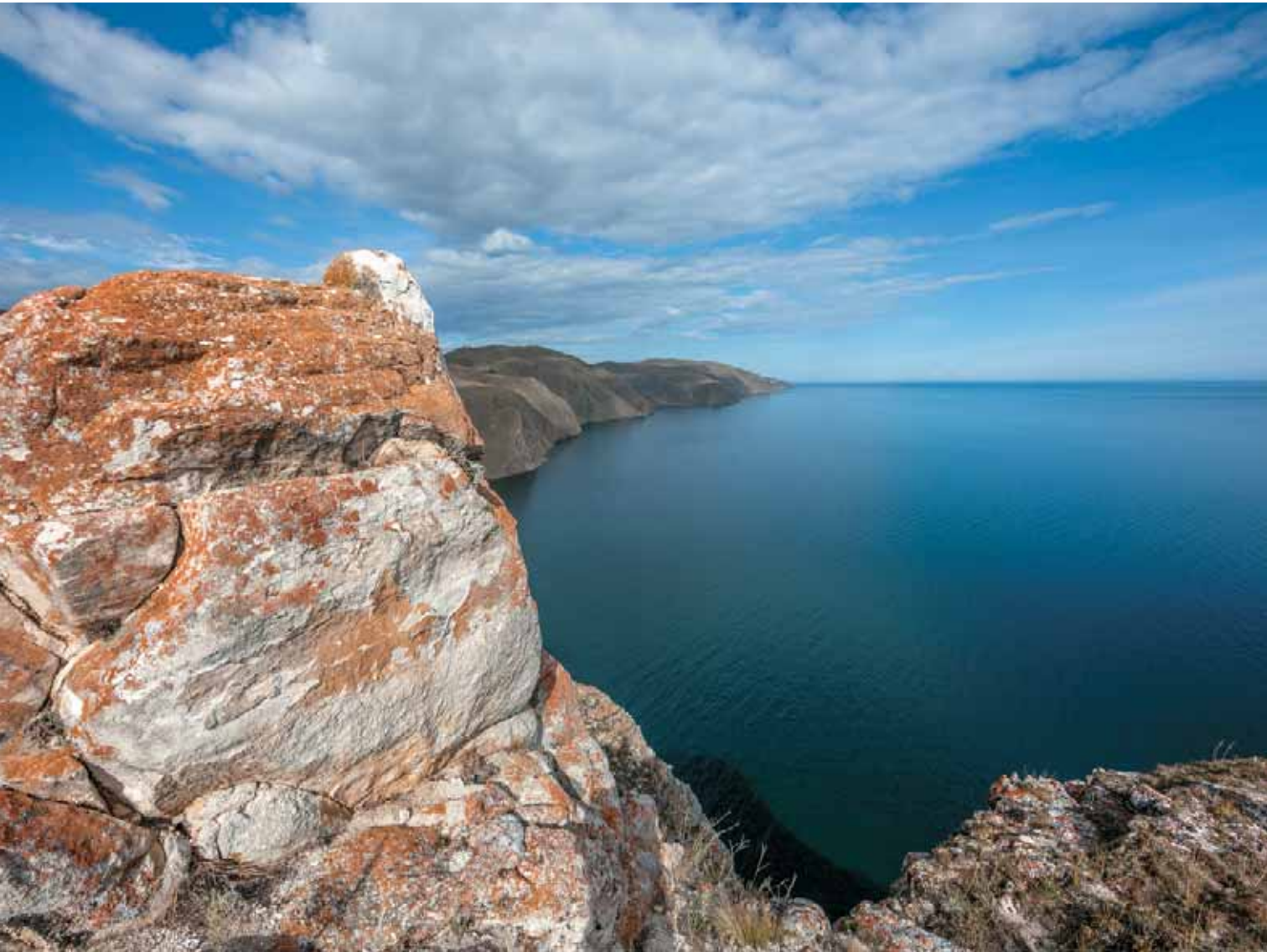
Панорама средней котловины озера Байкал с высоты берегового утеса.

* Один из первых восхищенных отзывов о Байкале из русских людей оставил протопоп Аввакум. При возвращении из даурской ссылки неистовому протопопу пришлось летом 1662 года переправляться с восточного берега моря-озера на западный, и он пишет о Байкале: