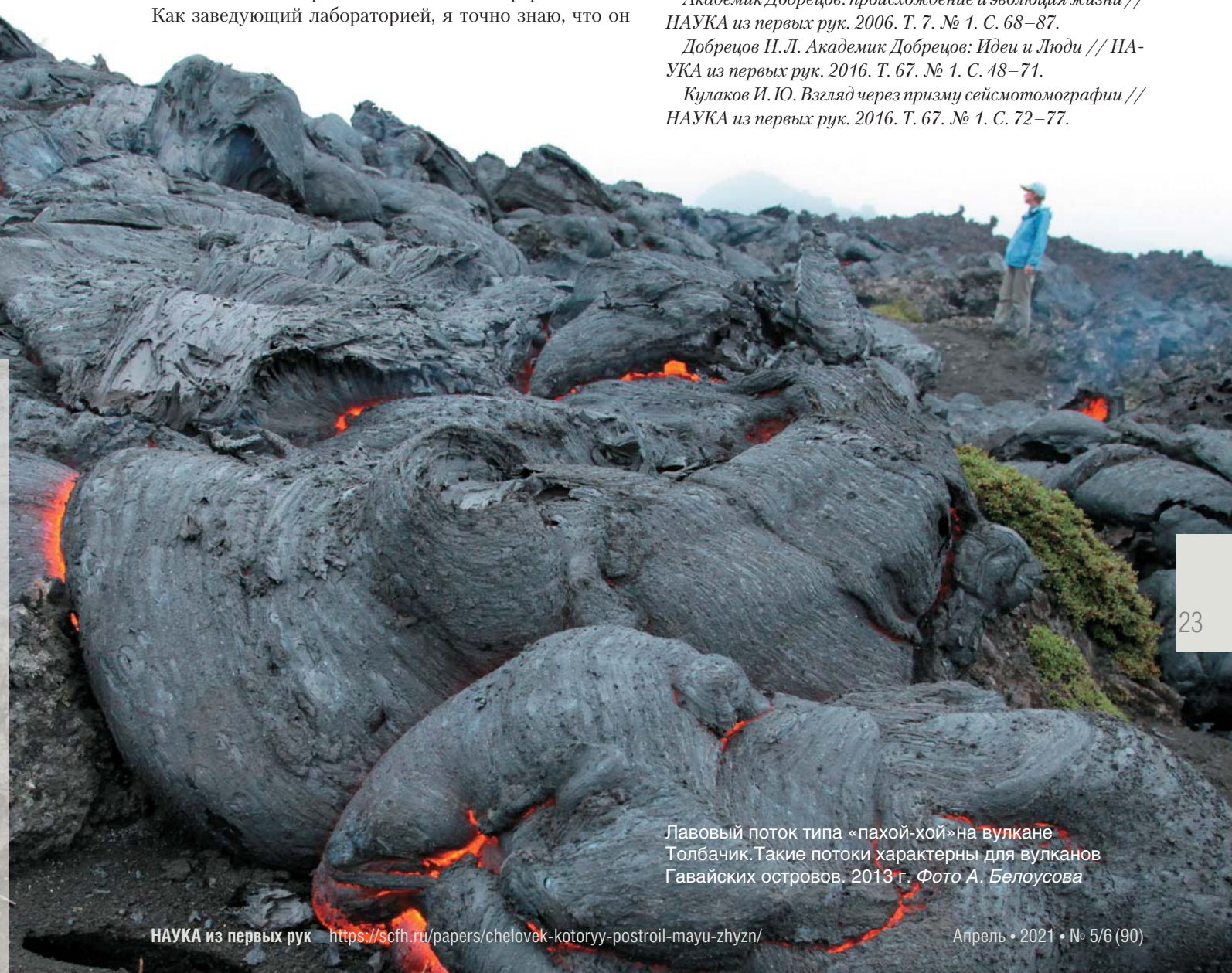
Лавовый поток типа «пахой-хой» на вулкане Толбачик. Такие потоки характерны для вулканов Гавайских островов. 2013 г.

Кулаков И.Ю. Взгляд через призму сейсмотомографии // НАУКА из первых рук. 2016. Т. 67. № 1. С. 72–77.