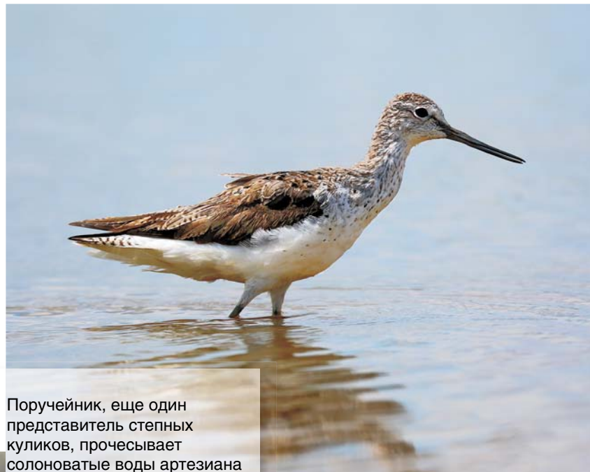
Поручейник, еще один представитель степных куликов, прочесывает солоноватые воды артезиана в поисках добычи – водных беспозвоночных