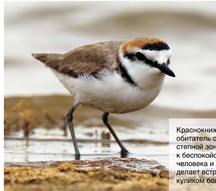
Краснокнижный морской зуек – обитатель соленых водоемов степной зоны. Нетерпимость к беспокойству со стороны человека и домашнего скота делает встречу с этим южным куликом большой редкостью

Для многих видов водоемы в степи – основной источник корма. Разнообразные виды куличков кормятся на мелководье: это и степные тиркушки ( Glareola nordmanni ), и поручейники ( Tringa stagnatilis ), и морские зуйки ( Charadrius alexandrinus ), и турухтаны ( Philomachus pugnax ), и многие другие. Стаи черных ( Chlidonias niger ) и белокрылых