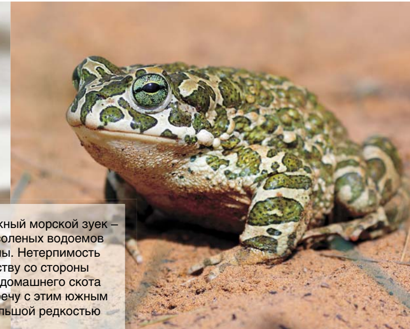
Зеленые жабы ( Bufo viridis ) ведут сумеречный и ночной образ жизни, однако ранним утром и они приходят к артезианам в поисках добычи