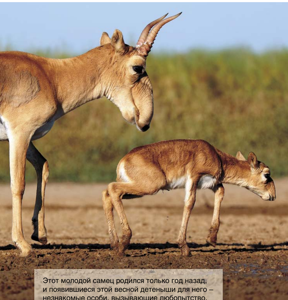
Этот молодой самец родился только год назад, и появившиеся этой весной детеныши для него – незнакомые особи, вызывающие любопытство. Для самого сайгачонка рогатый самец тоже в новинку, ведь раньше до прихода на артезиан его окружали только самки

Трудно переоценить значение, которое играют артезианы для сайгака – современника мамонтов, дожившего до наших дней. Сайгак ( Saiga tatarica ), согласно Красной книге Международного союза охраны природы относится к категории «CR» (англ.: Critically Endangered), т. е. является видом на грани исчезновения (Mallon, 2008). Такую категорию присваивают виду, если его численность сократилась или может сократиться на 80% в течение трех поколений. Следующая категория – это уже полное исчезновение вида в дикой природе. При такой малой численности сайгака сохранение артезианов в целинных степях имеет решающее значение по целому ряду причин.