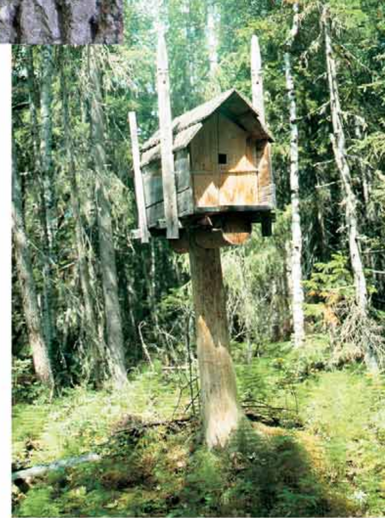
Действующий амбарчик Нер-ойки и Чохрынь-ойки. 1990 г.

Встретивший нас берег оказался болотистым, пришлось часть пути прыгать по кочкам, затем тропинка стала посуше, а лес пореже, и некоторое время спустя сквозь стволы деревьев мы увидели первый амбарчик, стоявший на одной опоре: домик покосился и был готов упасть. Амбарчиков ( сумьяхов ) оказалось три, с десятков метров отделял один от другого, и было хорошо заметно