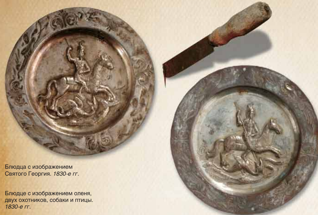
Блюдца с изображением Святого Георгия. 1830-е гг.