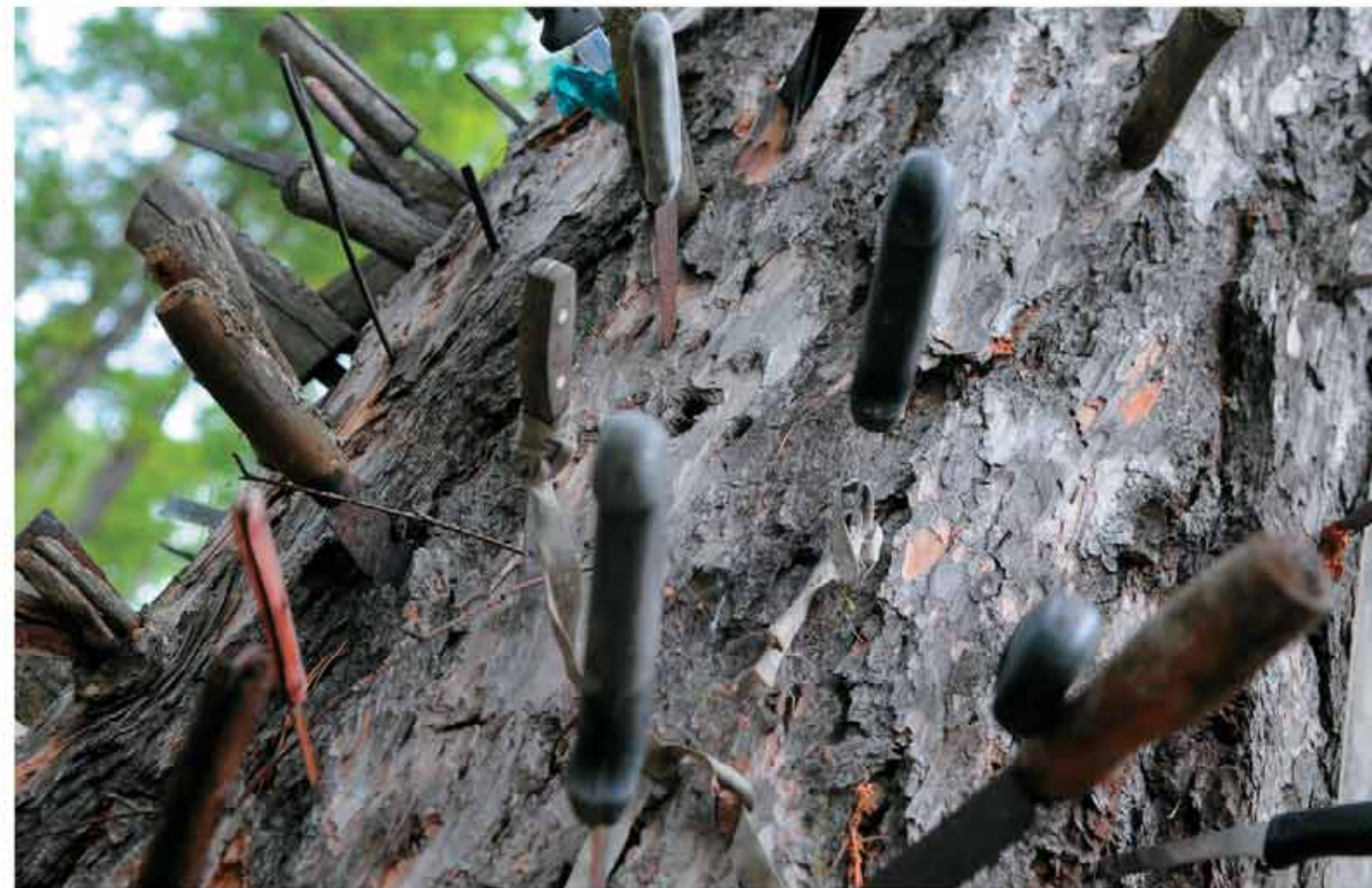
Подношения Чохрынь-ойке – воткнутые в ствол лиственницы ножи. 2009, 2014 гг.

Приходят к лиственнице довольно часто: как редкие жители Вежакар, так и многочисленные проезжающие