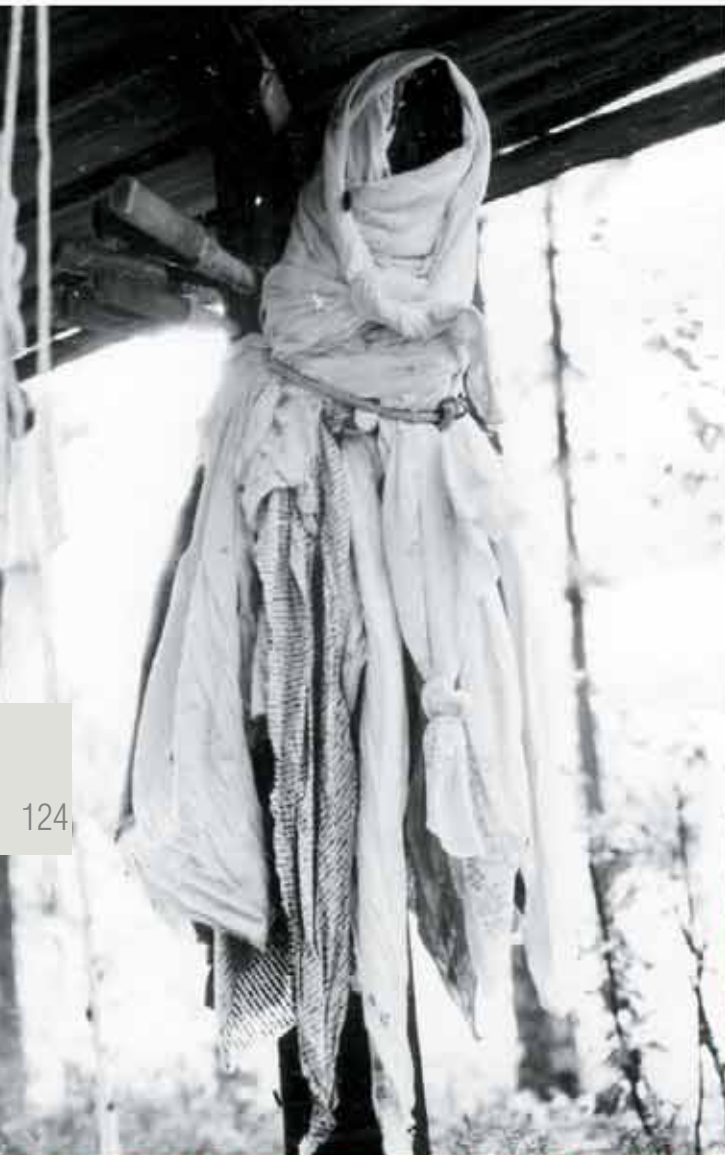
Фигура Чохрынью-ойки под навесом. 1989 г.

Сам Чохрынью-ойка (узкого ножа хозяин-божество, покровительствующий в охоте и рыбной ловле) имеет вид двухаршинного бревна с заостренным верхним концом, на котором грубо вырезаны нос, рот и глаза. На голове у него был колпак, сшитый из семи полос цветного сукна и опушенный соболем. Туловище его