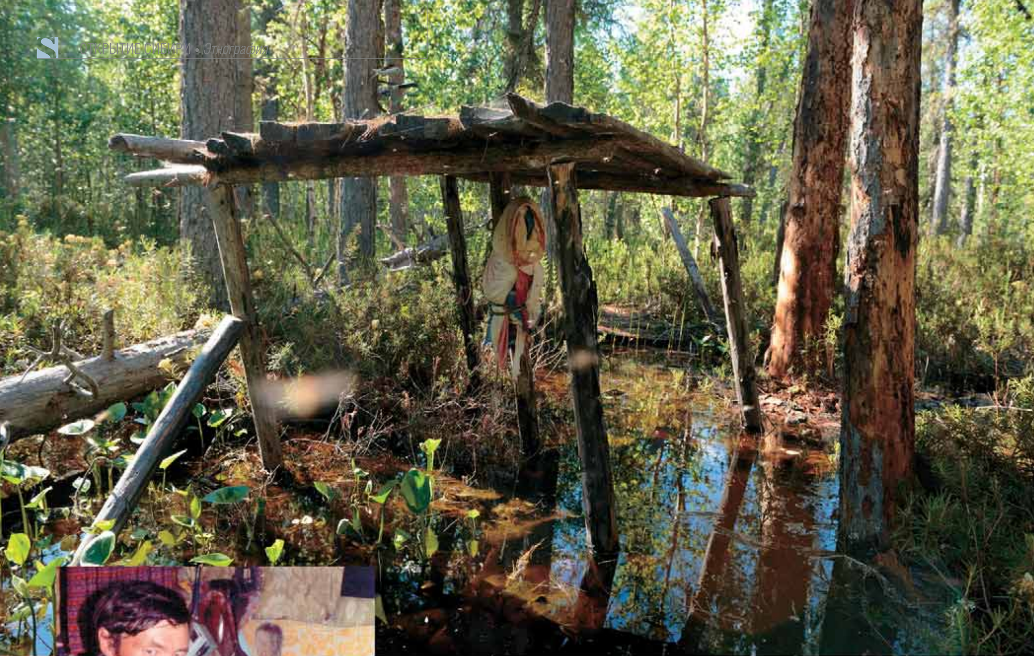
Фигура Чохрын-ойки под навесом. 2014 г.