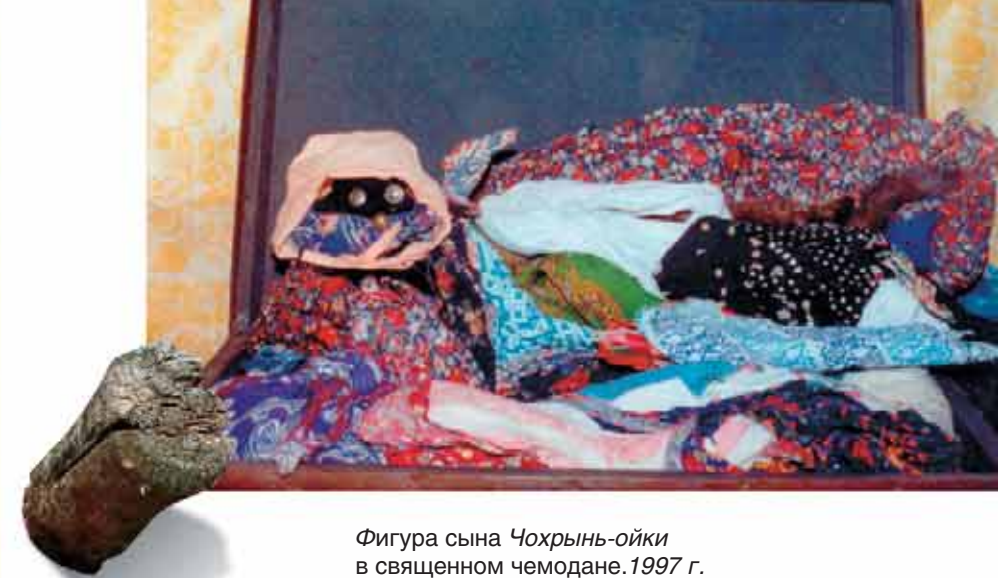
Фигура сына Чохрын-ойки в священном чемодане. 1997 г. Внизу – фигура Чохрын-ойки под навесом. 2014 г.

Поворожив таким образом минут десять, вогул объявил ответ Чохрын-ойки, благоприятный для Хуры-хум, что предстоящая охота принесет хорошую добычу. После окончания ворожбы на площадку вывели теленка, поставили головой к изображению и Хуры-хум покрыл его платком с завязанными в углах монетами. Справа от теленка встал другой вогул, он оглушил