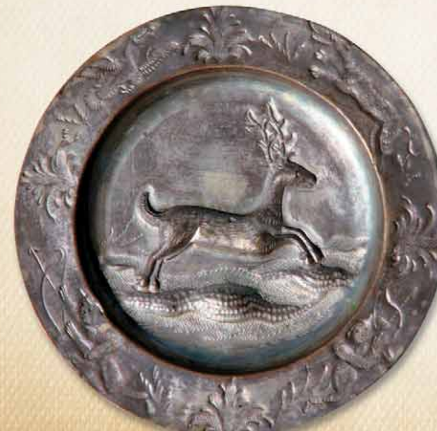
Блюдце с изображением оленя, двух охотников, собаки и птицы. 1830-е гг.