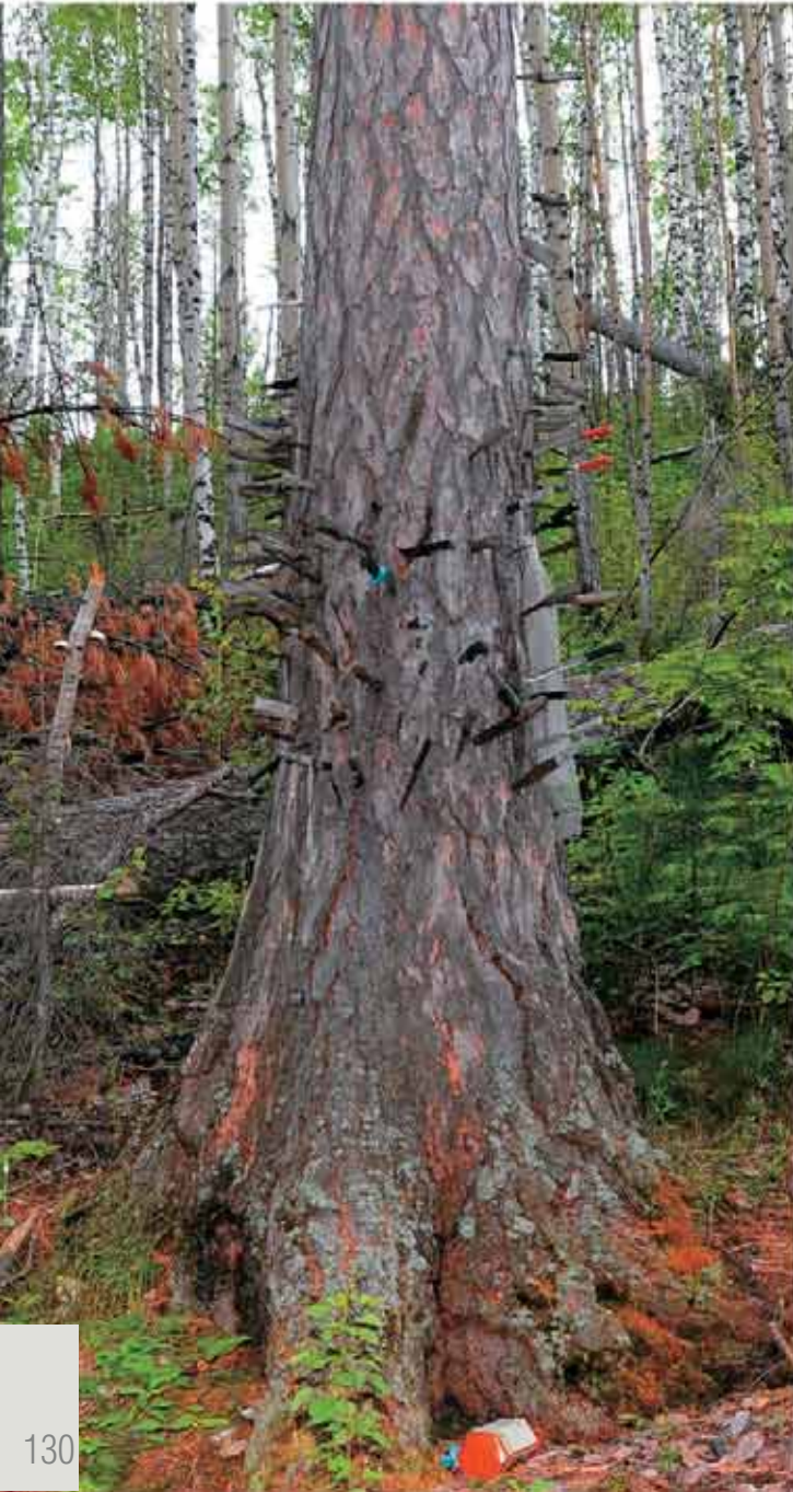
Священное место Чохрынь-ойки на Оби. 2009 г.

на четырех сосновых столбах был установлен новый навес из колотых плах со скатом назад. В середине под навесом был вкопан еще один столбик, к которому веревками привязана фигура Чохрынь-ойки, завернутая в белые платки с завязанными в углах монетами.