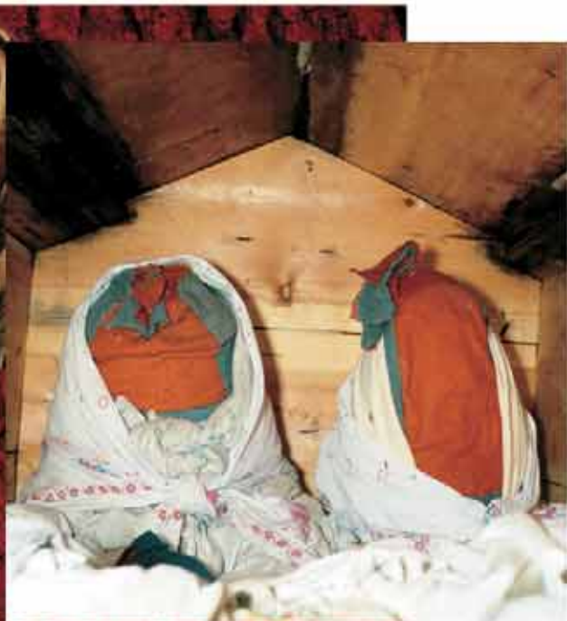
Нер-ойка и Чохрын-ойка в амбарчике. 1990 г.

поставлено духам, И. Н. Гемуев еще долго продолжал расспрашивать хранителя места об особенностях обряда посещения, а я фотографировал амбарчики, снимал их размеры, рисовал план ритуальной площадки. Наконец дверцу установили на место, положили лестницу и двинулись в обратный путь.