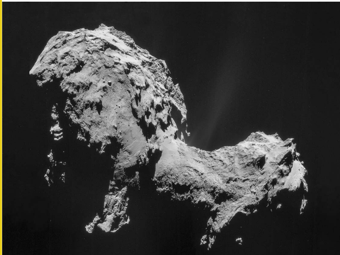
В августе 2014 г. «Розетта» наконец вошла в кометное облако. В это время были сделаны самые эффектные снимки приближающегося и вращающегося кометного ядра. На фото – комета 67P.

Комета Чурюмова – Герасименко, открытая еще в 1969 г. двумя советскими астрономами, – это рядовая комета с коротким периодом обращения, равным 6,6 года, и средней скоростью орбитального движения 18 км/с. Ее удаление от Солнца не превышает радиуса орбиты Юпитера, а траектория хорошо предсказуема, что позволяет выбрать правильное стартовое окно для запуска космического аппарата. Комета имеет массу около 10 млрд тонн, объем 25 км 3 , период вращения 12,5 ч.