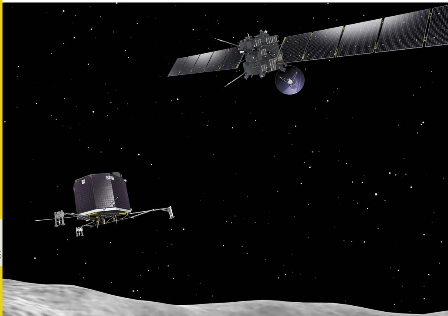
Посадочный модуль «Филы», отделившийся от аппарата «Розетта», готовится к посадке на комету 67P (Чурюмова – Герасименко)

Журнал Science ежегодно публикует в декабре список из десяти научных прорывов ушедшего года. Авторитетные отечественные ученые, уже традиционно, комментируют на страницах нашего журнала эти достижения, одновременно знакомя читателей с работами российских исследователей в актуальных научных областях