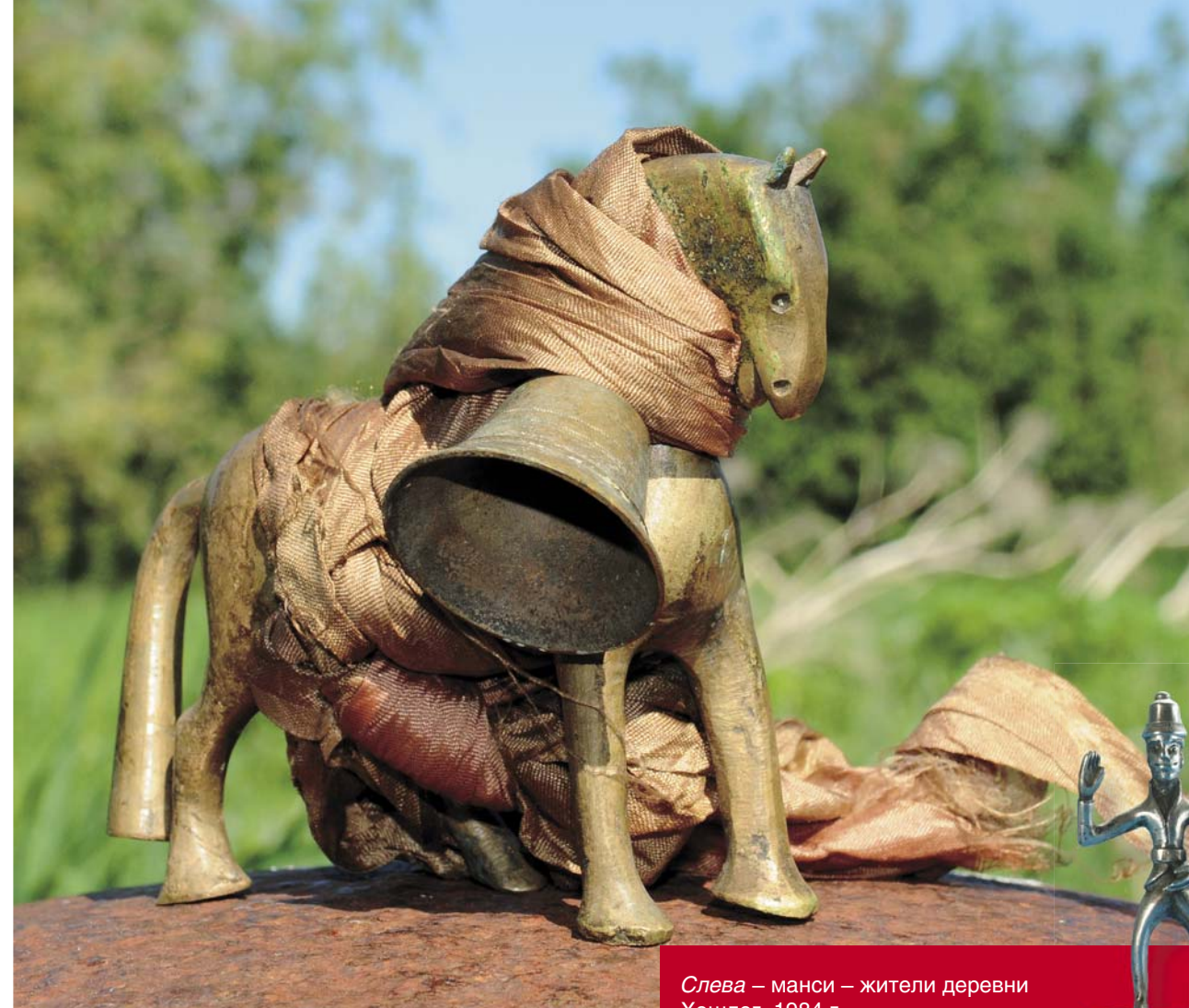
Слева – манси – жители деревни Хошлог. 1984 г. Вверху – медная лошадка

Напомню, что в обрядовой практике обских угров еще в эпоху средневековья использовались металлические статуэтки – местные бронзовые фигурки животных и птиц, а также поступившие с Востока серебряные фигурные изображения (слона, головы чудовища, девушки