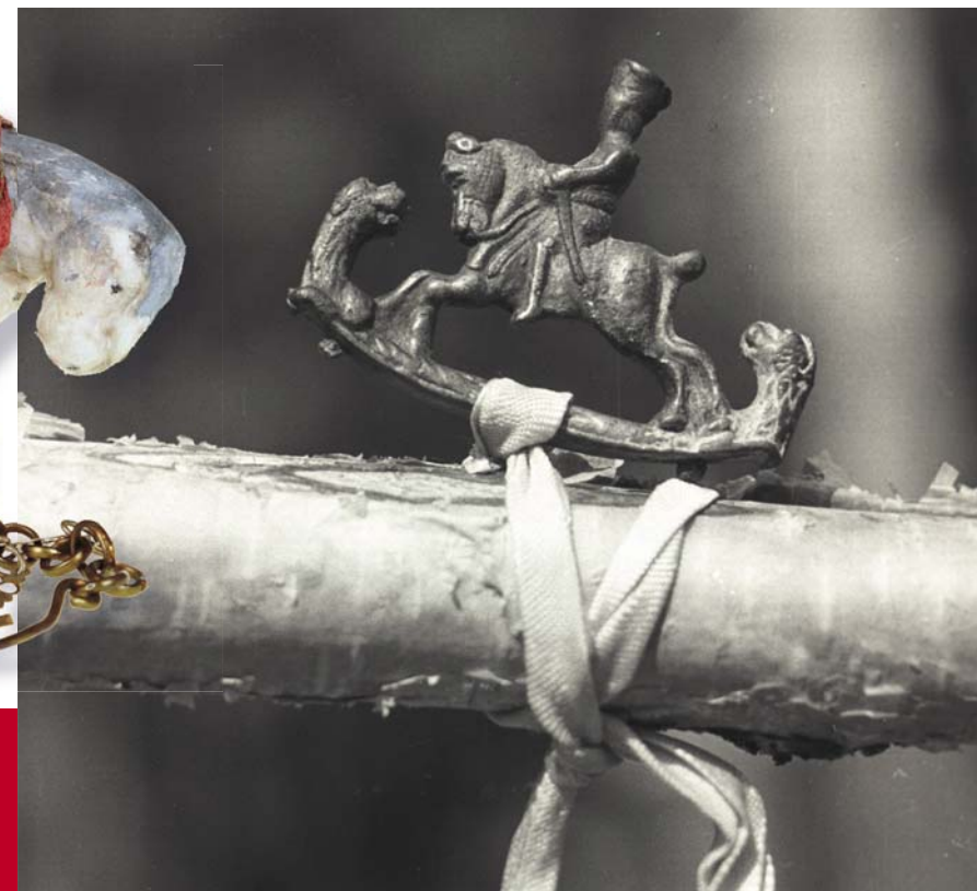
Серебряная фигурка всадника