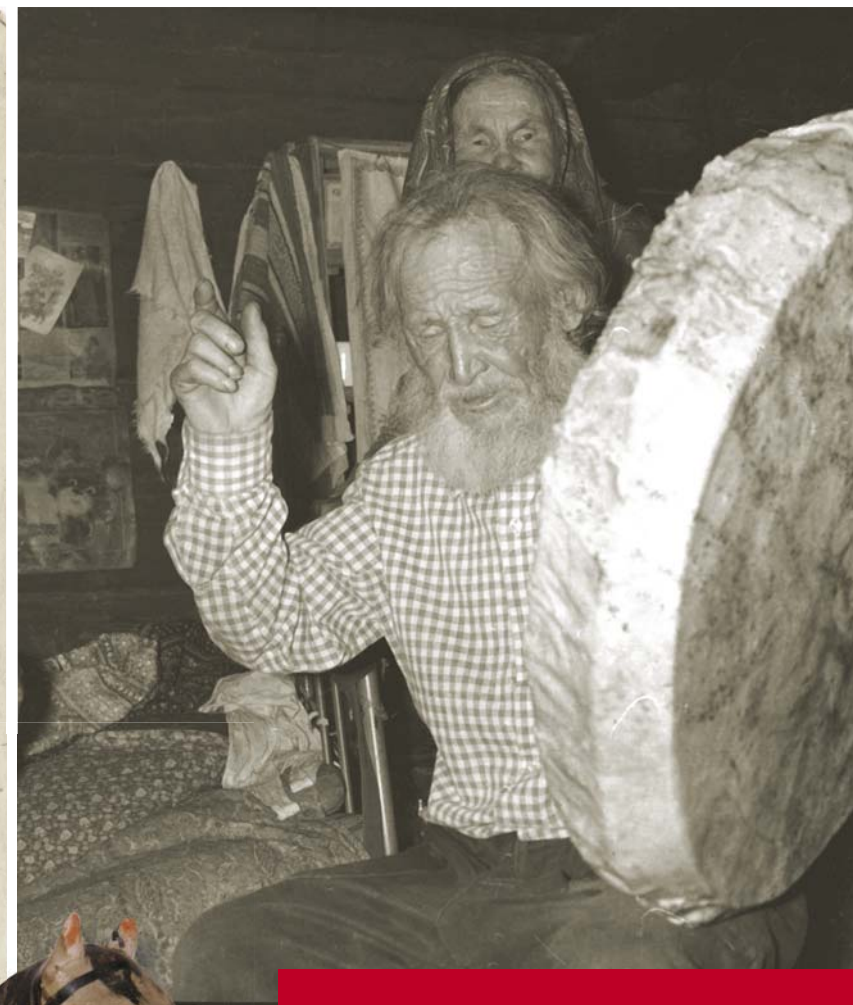
Камлание шамана с бубном. 1989 г. Всадник из папье-маше

Достаточно много игрушек в домашних святилищах манси и хантов нам удалось описать на рубеже XX–XXI вв. Семейный божок манси Хозумовых (Березовский район ХМАО – Югры) выполнен в виде большой антропоморфной фигуры,