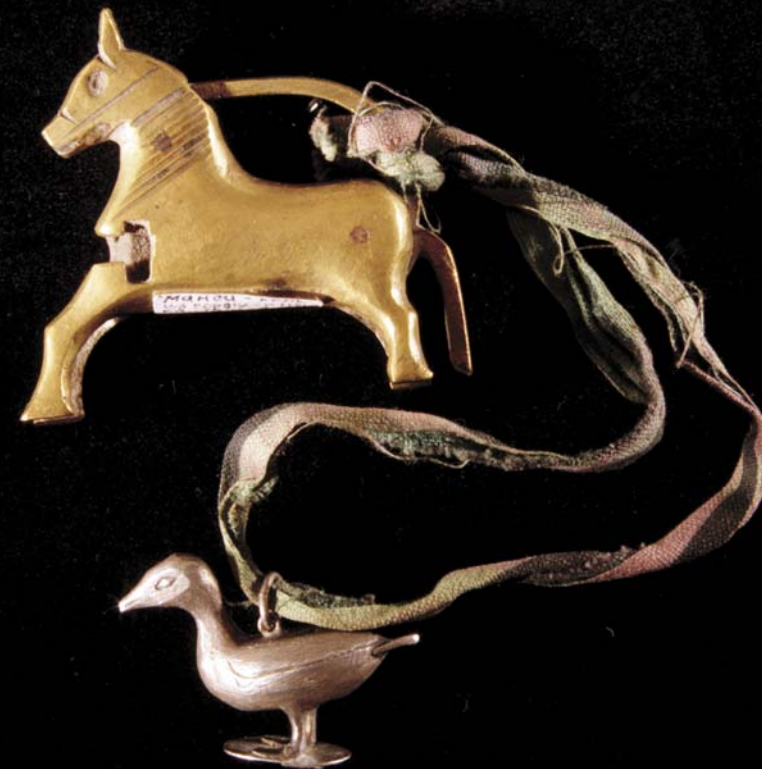
Русский замок в виде фигурки лошади. Внизу – фигуры оленя из состава домашней атрибутики обских угров

рованного слова «медведь». Манси и ханты верили, что Ялтус-ойка помогает больным и приносили ему кровавую жертву. На Северной Сосьве и верхней Лозьве ему обещали в жертву черный платок при бессоннице или «тягости». Верили, что Ем-вож-ики помогает женщине при родах. «Шустрый он, везде мог поспеть, по всем деревьям, все места