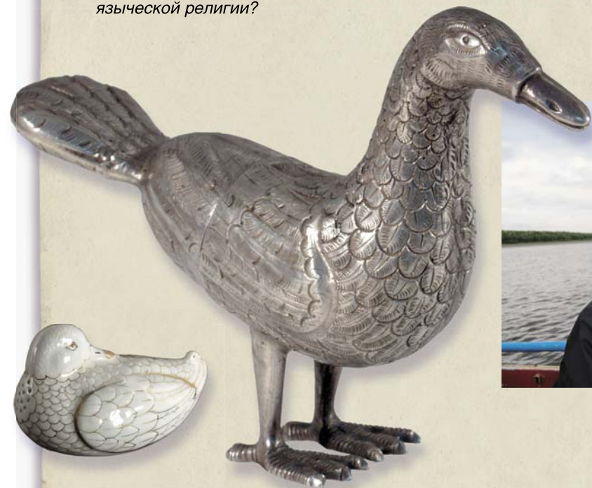
Серебряная статуэтка гуся – основа фигуры духа-покровителя манси и фарфоровая утка-солонка – культовый атрибут манси