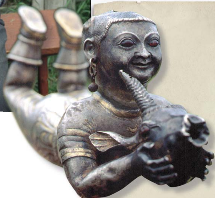
Хозяин домашнего святилища с фигурой духа-покровителя. Справа – фигурный ритон (VIII-нач. IX вв., Центральная Азия) в виде девочки с головой антилопы в руках – семейный дух-покровитель хантов

Начиная с раннего железного века для обозначения образа медведя использовали привозные бронзовые подвески, браслеты, пряжки, украшенные изображением головы животного. С приходом русских купцов на Север в обрядовую практику стали попадать винные бутылки емкостью 0,7 и 0,5 л, на одном из встреченных экземпляров обозначен год выпуска – 1888. Бутылки выполнены в виде сидящей фигуры медведя, которую ее владельцы обматывали в платки, куски ткани, вешали на горлышко низки медных колец и т.п. Во время обряда бутылку использовали и по прямому назначению: из нее в серебряную стопку наливали водку, которую в первую очередь подносили изображению божества. Из других культовых атрибутов можно упо-