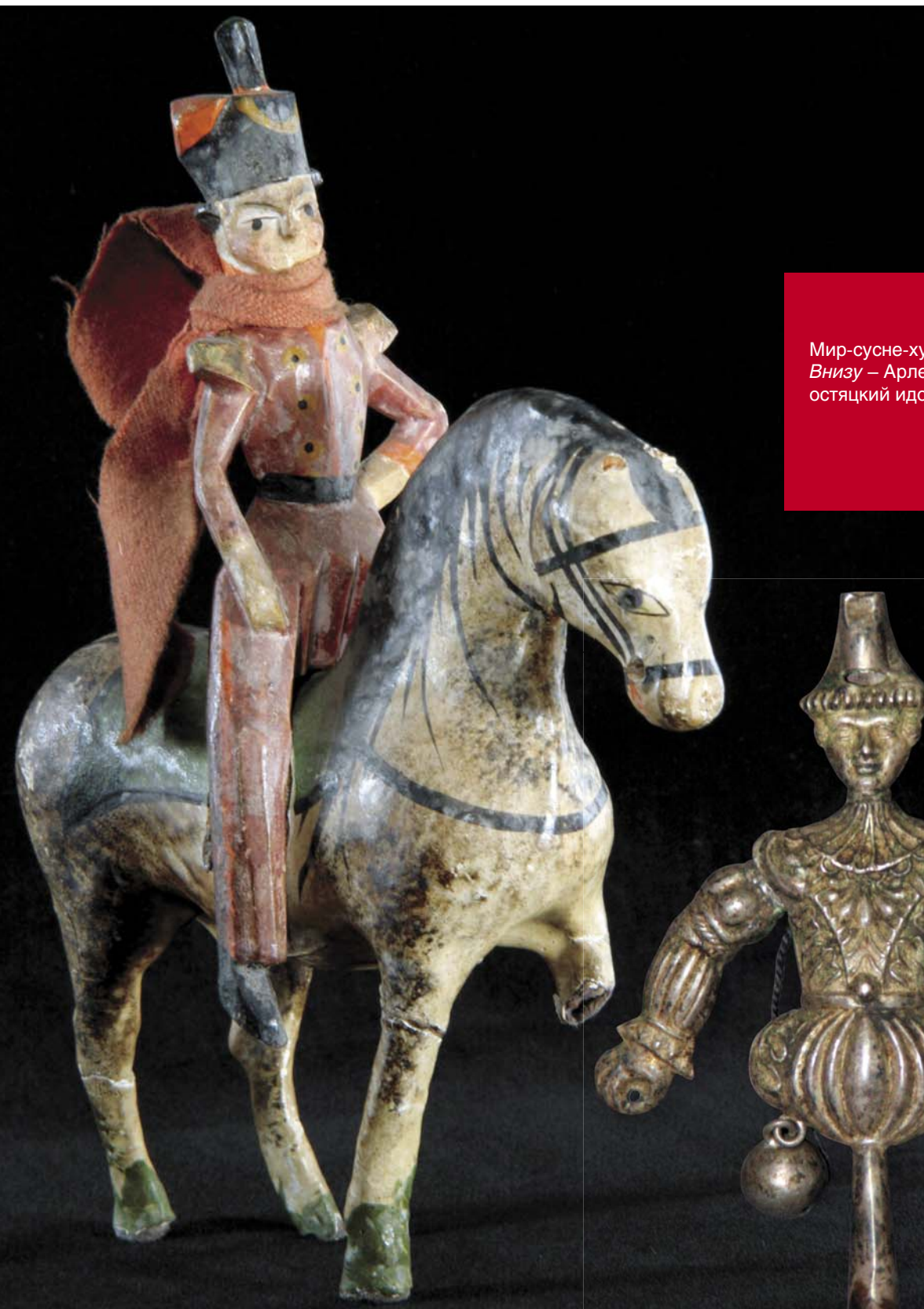
Мир-сусне-хум. Внизу – Арлекин, остяцкий идол