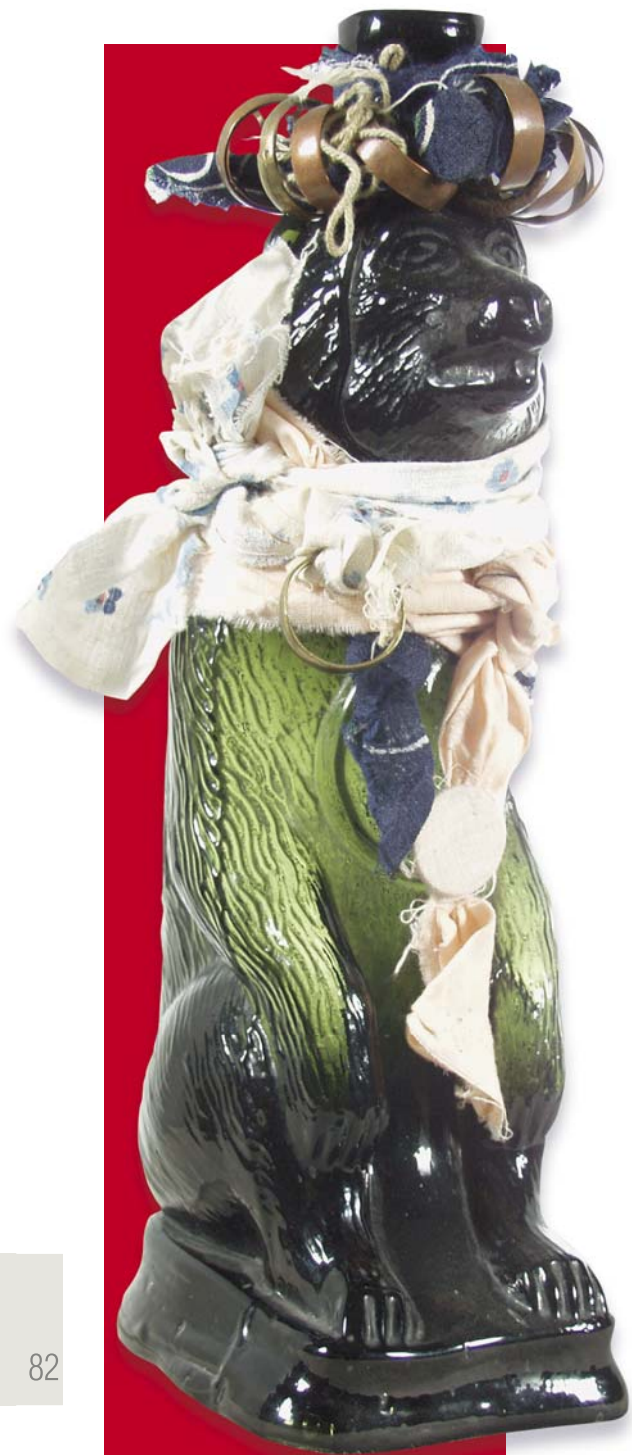
Фигура высшего божества в облике медведя. Справа – приклад (лошадка)