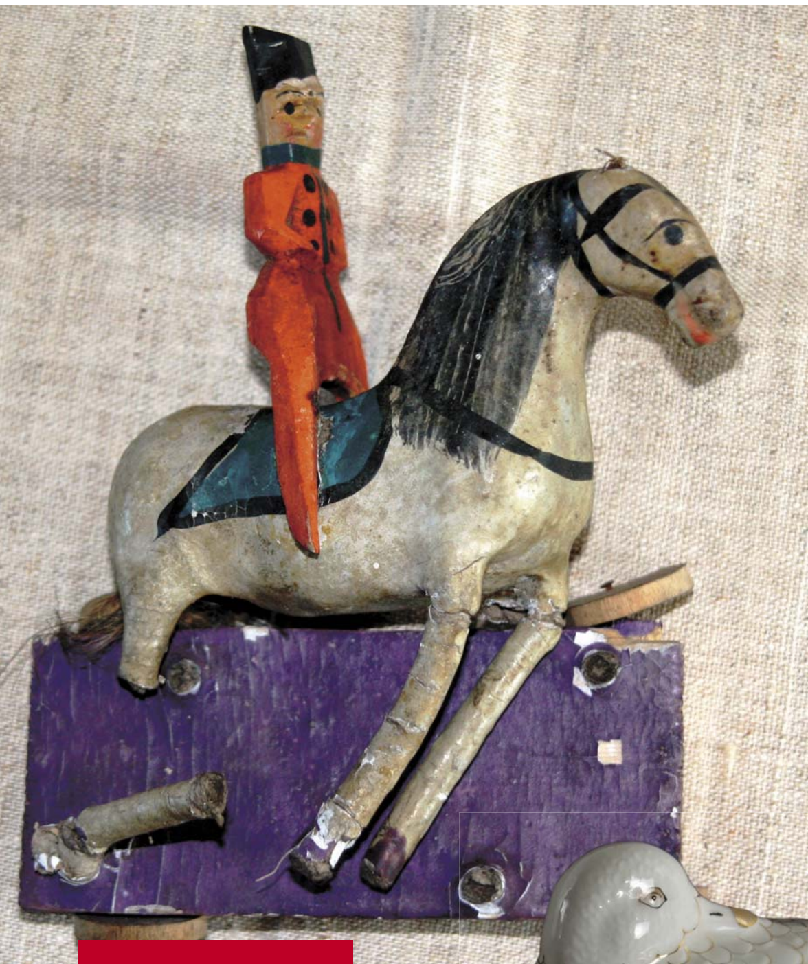
Всадник из папье-маше. Внизу – фарфоровая утка-солонка – культовый атрибут манси