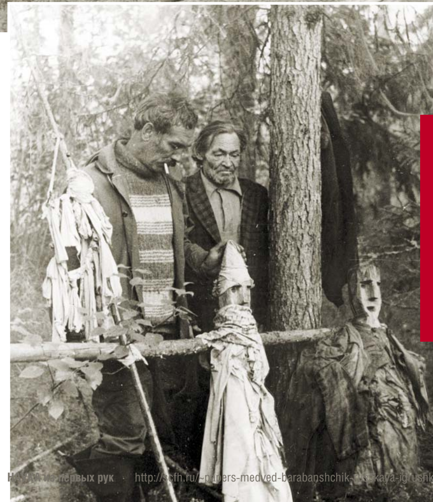
Манси – жители деревни Турват-пауль. 1990 г.