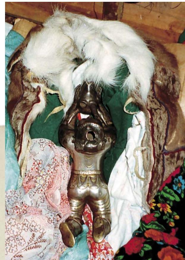
Девочка-ритон на фоне одежд – халатов и шубки из оленьего меха